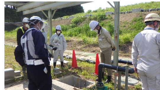
現地調査時の様子