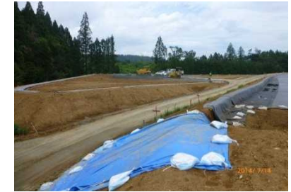
南相馬市大富地区における仮置場整備工事(平成26年7月)