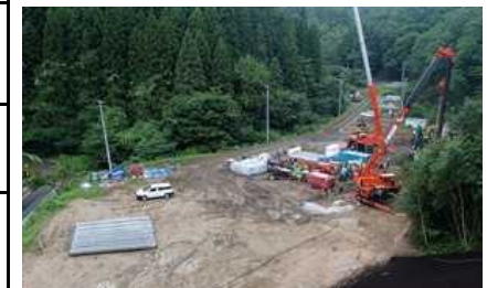
川内村における仮設焼却炉の建設状況(平成26年7月)