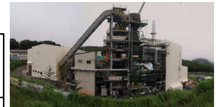
飯舘村小宮地区における仮設焼却炉の建設状況(平成26年7月)