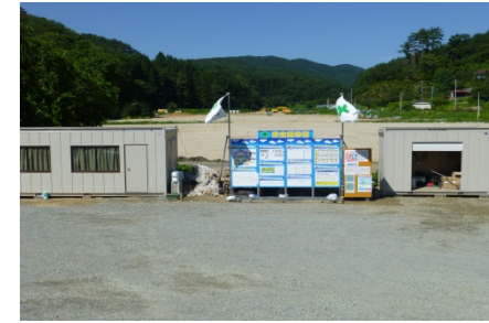
川俣町山木屋地区における仮置場整備状況(平成26年8月)