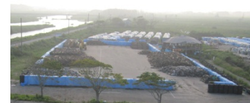
現地選別実施中の 浪江町マリンパークなみえ の状況 (平成26年8月)