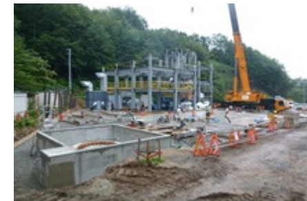
川内村における仮設焼却施設の建設状況(平成26年8月)