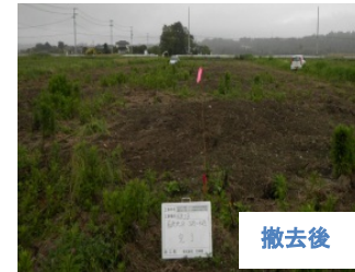
撤去後 撤去後(平成25年6月) 檜葉町前原地区における 災害廃棄物等の撤去状況