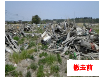
撤去前 撤去前(平成25年5月)