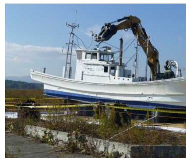
浪江町における 津波被災船舶の解体撤去状況 (平成26年11月)