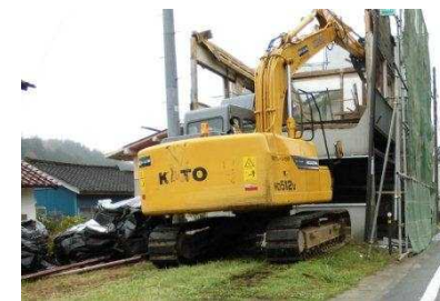
川内村における 家屋解体の状況 (平成26年11月)