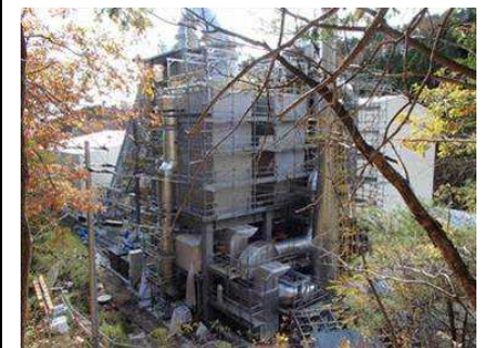
川内村の仮設焼却施設 (平成26年11月)