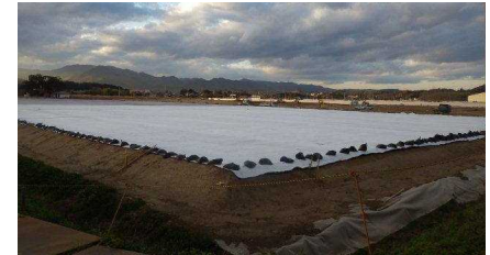
檜葉町前原地区における仮置場の整備状況 (平成26年11月)