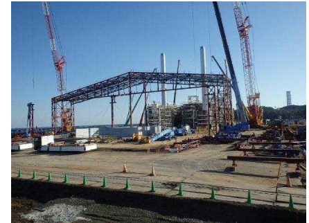
富岡町における仮設焼却施設の建設状況 (平成26年11月)