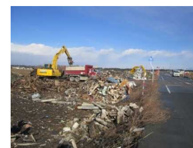
浪江町における津波がれきの撤去状況 (平成26年12月)