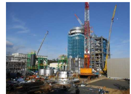
南相馬市における仮設焼却施設の建設状況(平成26年12月)