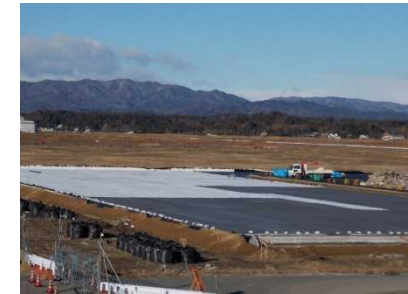
双葉町中野地区における仮置場の整備状況(平成26年12月)