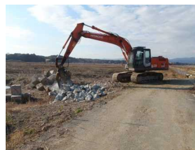
南相馬市における津波がれきの撤去状況 (平成26年12月)