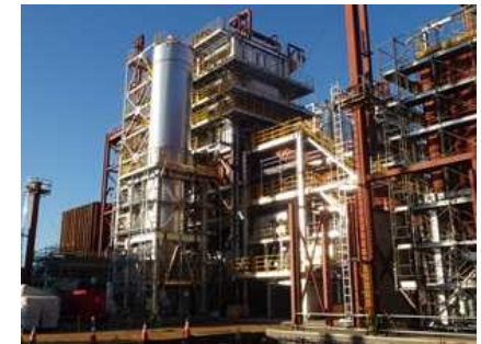
富岡町における仮設焼却施設の建設状況(平成26年12月)