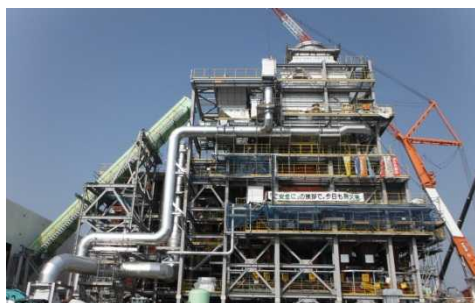
浪江町の仮設焼却施設 (平成27年4月)