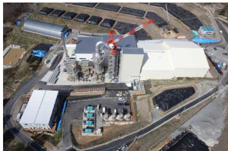
葛尾村の仮設焼却施設 (平成27年4月)