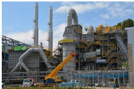
飯館村葦平地区の仮設焼却施設 (平成27年10月)

【仮置場の確保状況】 ■ 供用開始済 ■ 原状復旧済 ● 仮設焼却施設 (建設工事中等を含む) □ 汚染廃棄物対策地域 ■ 避難指示解除準備区域 ■ 居住制限区域 ■ 帰還困難区域