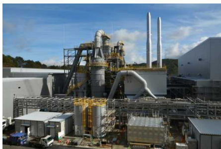
飯舘村蕨平地区の仮設焼却施設 (平成27年11月)