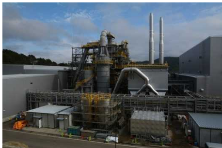
飯舘村 藤平地区の仮設焼却施設 (平成27年12月)

□ 汚染廃棄物対策地域 □ 避難指示解除準備区域 ■ 居住制限区域 ■ 帰還困難区域