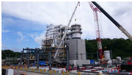
楢葉町の仮設焼却施設 (平成28年6月)