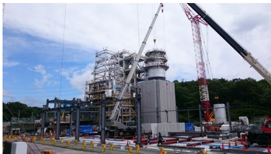
楡葉町の仮設焼却施設 (平成28年6月)