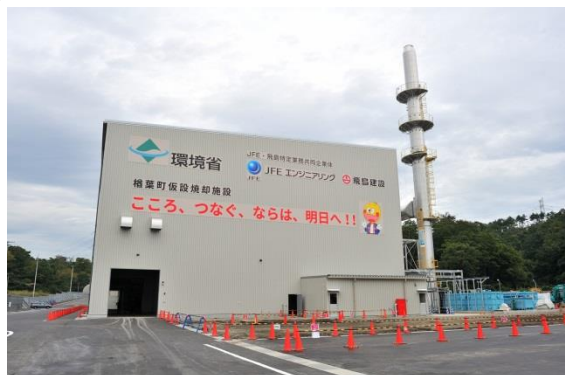
楢葉町の仮設焼却施設 (平成28年10月)