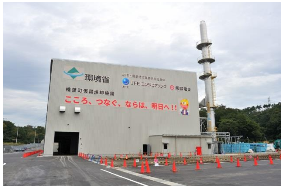
楡葉町の仮設焼却施設 (平成28年10月)