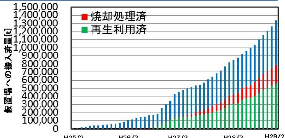
対策地域内の災害廃棄物等の仮置場への搬入済量

○ ステーション回収や戸別回収訪問を行っており、戸別回収については、希望者と日程を調整の上、回収を実施。