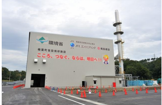
楡葉町の仮設焼却施設 (平成28年10月)