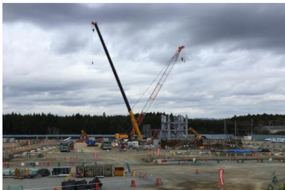
大熊町の仮設焼却施設(工事中)(平成29年4月)

■ 汚染廃棄物対策地域 ■ 避難指示解除準備区域 ■ 居住制限区域 ■ 帰還困難区域