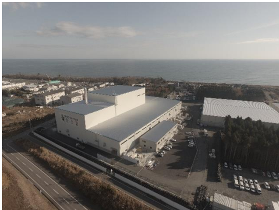
大熊町の仮設焼却施設(平成29年12月)