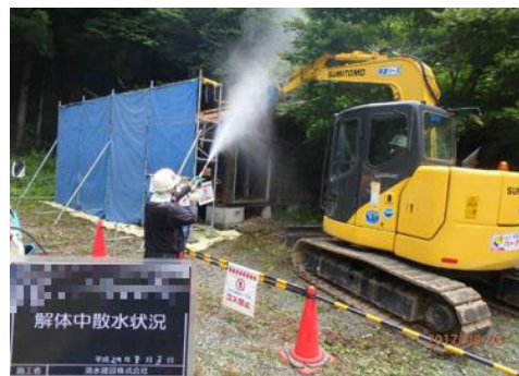
被災家屋等の解体の様子