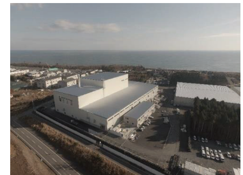
大熊町の仮設焼却施設