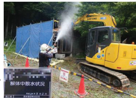
被災家屋等の解体の様子