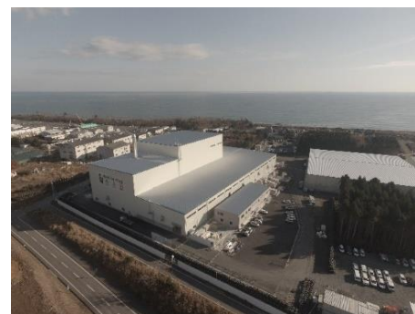
大熊町の仮設焼却施設