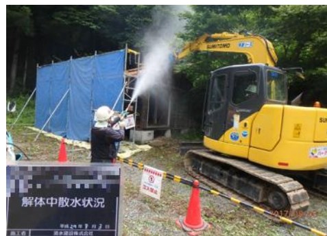
被災家屋等の解体の様子