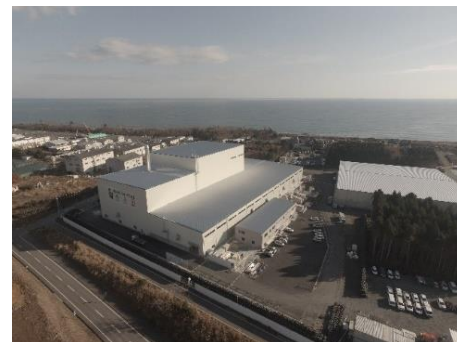
大熊町の仮設焼却施設