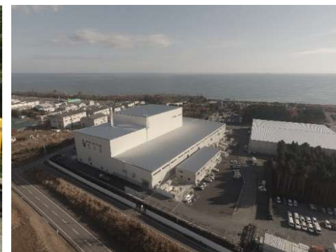
大熊町の仮設焼却施設