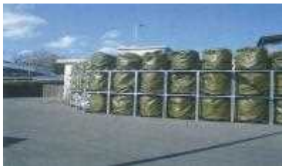
(焼却灰をフレキシブルコンテナに詰め敷地内に保管)