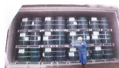
(焼却灰をドラム缶に詰めコンクリートカルバート内で保管)