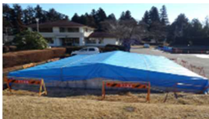
(天日乾燥床をブルーシートで被覆)