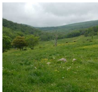
植生自然度5(草原) 二次草原(背の高い草 原)