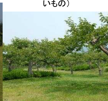
植生自然度3(果樹園) 耕作地(樹園地)