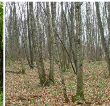
植生自然度7(コナラ二 次林)二次林