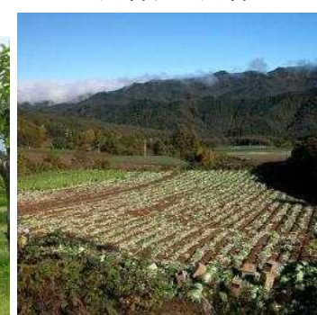
植生自然度2(畑) 農耕地(水田・畑)、緑 の多い住宅地等