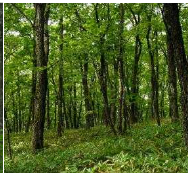
植生自然度8(ミズナラ二 次林)二次林(自然林に近 いもの)