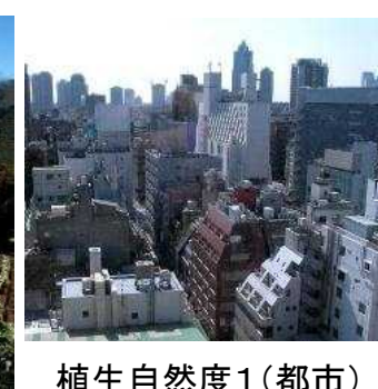
植生自然度1(都市) 市街地・造成地等