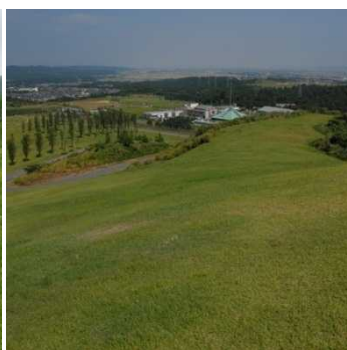
植生自然度4(シバ草 原)二次草原(背の低い 草原)