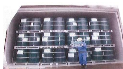
(焼却灰をドラム缶に詰めコンクリートカルバート内で保管)