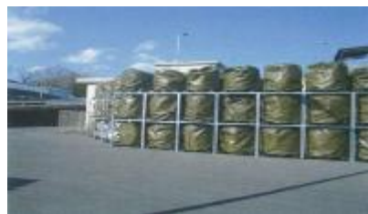
(焼却灰をフレキシブルコンテナに詰め敷地内に保管)