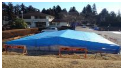
(天日乾燥床をブルーシートで被覆)