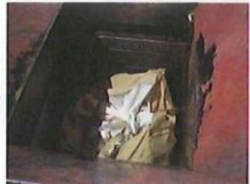
大型圧縮梱包機で土のうのまま4袋を投入