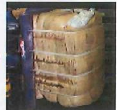
4袋分の圧縮物を1袋の大型土のうに封入し、バンドで結束