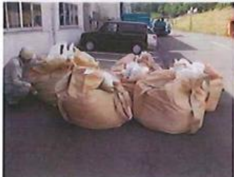
破砕した廃棄物を1m 3 大型土のうに半分(約0.5m 3 )充填