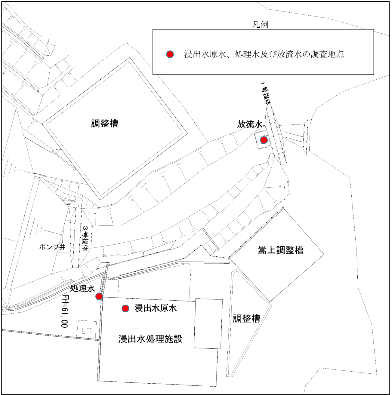
浸出水原水、処理水及び放流水の調査地点図