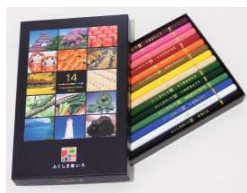
▲ 色鉛筆「ふくしまのいろ」

優良賞：福島県限定色鉛筆「ふくしまのいろ」＋富岡町と楮葉町の特産品 入賞：福島県限定色鉛筆「ふくしまのいろ」