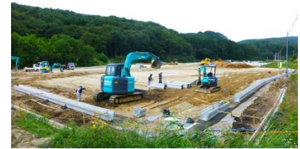
川俣町山木屋地区における仮置場整備状況(平成26年9月)