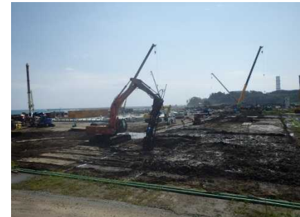
富岡町における仮設焼却施設の建設状況(平成26年9月)