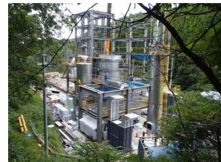
川内村における仮設焼却施設の建設状況(平成26年9月)