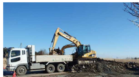
双葉町における 津波がれきの撤去状況 (平成27年1月)