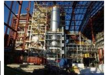
富岡町における仮設焼却施設の建設状況(平成27年1月)