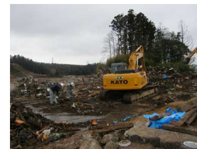
富岡町における 津波がれきの撤去状況 (平成27年1月)