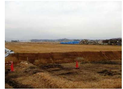
双葉町中野地区における仮置場の整備状況(平成27年1月)