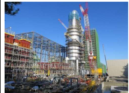
南相馬市における仮設焼却施設の建設状況(平成27年1月)