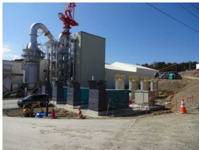
葛尾村における仮設焼却施設 (平成27年4月)