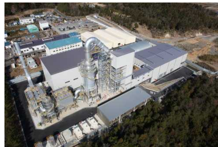
南相馬市の仮設焼却施設 (平成27年3月)