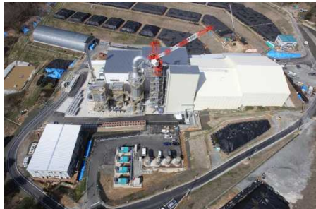
葛尾村の仮設焼却施設 (平成27年4月)