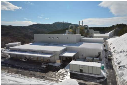
飯舘村蕨平地区の仮設焼却施設 (平成28年1月)