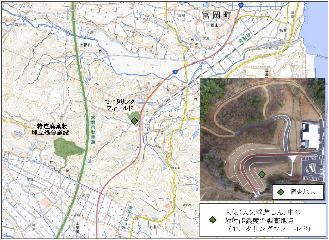
大気(大気浮遊じん)中の放射能濃度の調査地点 (モニタリングフィールド)