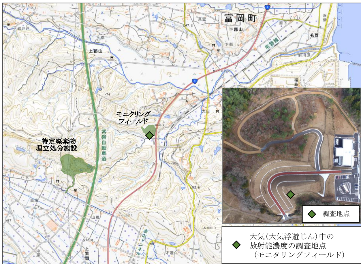
大気(大気浮遊じん)中の放射能濃度の調査地点 (モニタリングフィールド)